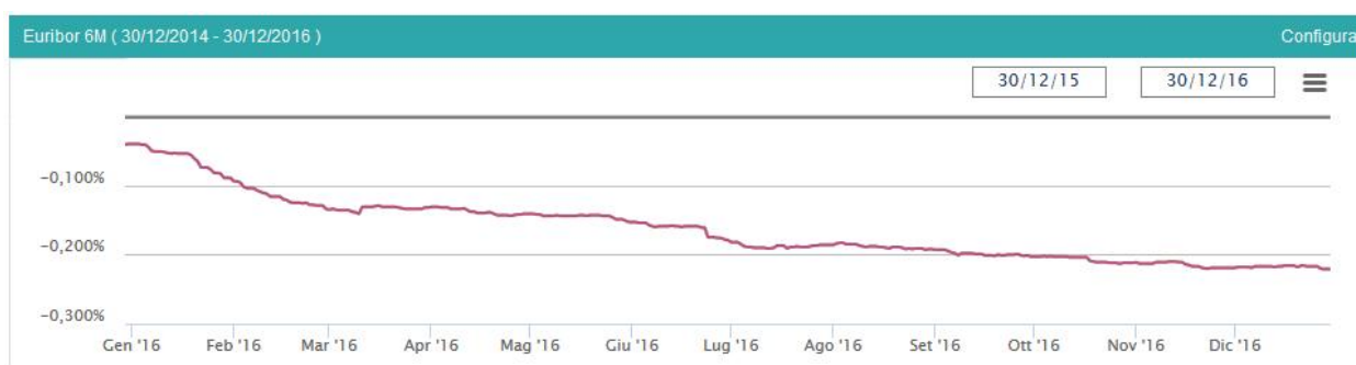
GRAFICO 1: ANDAMENTO DELL'INDICE EURIBOR 6 MESI

In riferimento invece alla rischiosità degli investimenti in titoli obbligazionari, in particolare in riferimento ai titoli di stato italiani, nel 2016 si è registrato un peggioramento nella percezione della rischiosità relativa al default dello stato, ciò ha portato ad una crescita delle quotazioni dei Credit Default Swap collegati. La Repubblica Italiana non ha visto modifiche del rating nel 2016, che rimane pari a BBB-/Baa2/BBB+ per le tre principali agenzie internazionali; il 7 dicembre 2016 l'agenzia Moody's ha rivisto al ribasso le prospettive per l'Italia, tagliando l'outlook da "stabile" a "negativo" confermando in ogni caso il rating "Baa2". L'outlook negativo implica che la prossima mossa dell'agenzia americana possa essere quella di tagliare il rating sovrano se le condizioni che hanno spinto a rivedere l'outlook dovessero persistere.